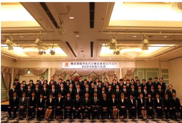
東日本カンパニー新入社員 集合写真

【東日本カンパニー入社式】 日時:2024年4月1日 場所:ヒルトン東京お台場(東京都港区)