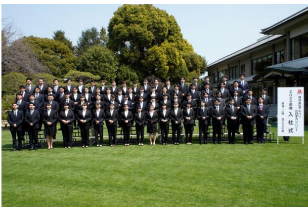
北日本カンパニー新入社員 集合写真

【北日本カンパニー入社式】 日時:2024年4月2日 場所:明治記念館(東京都港区)