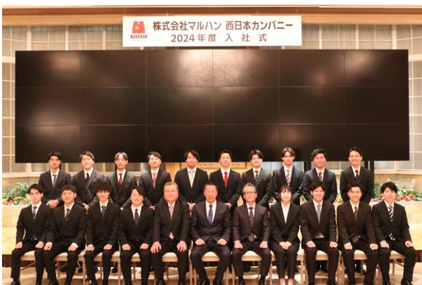
西日本カンパニー新入社員 集合写真

【西日本カンパニー入社式】 日時:2024年4月4日 場所:ホテルモントレグラスミア大阪(大阪府大阪市)