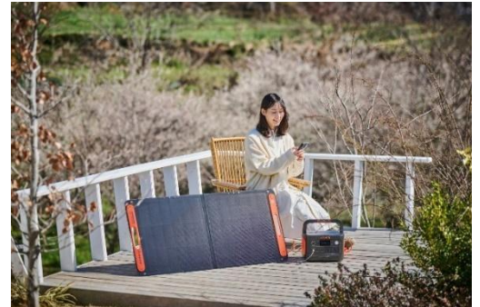
Jackery SolarSaga 100

また、オフライン店舗販売でセットとなるソーラーパネル「Jackery SolarSaga 100 Mini」は、パネルの裏表両面で発電ができる商品です。両面受光設計により、単面パネルよりも発電量を最大 25% 増加させました。「Jackery SolarSaga 100」よりもコンパクトに収納でき、持ち運びも簡単です。