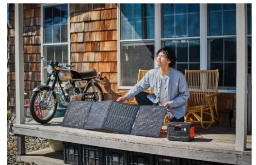
Jackery SolarSaga 100 Mini