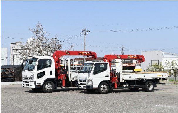
クレーントラック

バン（軽～ワンボックス）、冷凍車（軽～4t）、クレーン（2～4t）、ダンプ（軽～大型）、平トラック（軽～4t）、特殊車両など幅広いラインアップを取りそろえています。