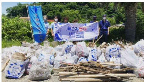
▲ 昨年度の開催の様子

下田海中水族館では、本年度も定期的な清掃活動の実施を予定しており、来月の5月26日(日)には、ゴミゼロの日に合わせて、県内外から一般参加可能な清掃活動を実施します。