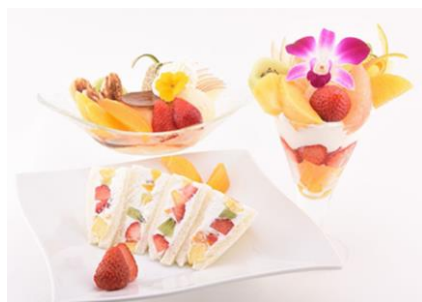
横浜の老舗青果店が運営する 「水信フルーツパーラーラボ」の お食事券が付いた宿泊プラン