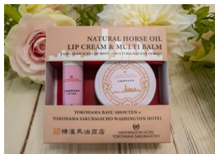
「横浜馬油商店」とコラボした オリジナルデザインの コスメアメニティ付きの宿泊プラン