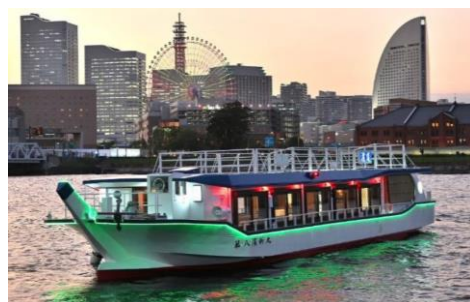
朝獲れの新鮮な海鮮を 横浜の屋形船「濱進」でいただける 夕食付き宿泊プラン