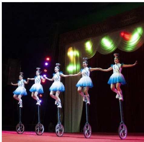
サーカス鑑賞&サーカスの演目を体験! in ポップサーカス