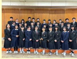
足立区立第十四中学校

私たちは、吹奏楽コンクールや定期演奏会だけでなく、駅伝や野球部の応援、パレード出演など多岐にわたる活動をしています。当日は皆様に素敵な時間をお届けできるよう、心を入れて演奏いたします。ぜひお楽しみください！