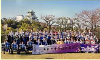
足立区立西新井中学校

「一音一心」を部訓として「厳しく、楽しく、仲良く」活動することが実行できるように日々努力しています。本日西新井中学校吹奏楽部の演奏を聴いてくださる方々との「一期一会」を大切に精一杯の演奏をさせていただきます。