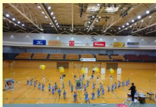
台東区立富士小学校

東京下町 浅草 浅草寺のお膝元にある学校で、教室の窓からスカイツリーが見えます。吹奏楽部は、音楽の練習はもちろんですが、「あいさつ、返事、感謝」を大切に、毎日明るく楽しく活動し、「第42回全日本小学生バンドフェスティバル」、「第51回マーチングバンド全国大会」の2つの大会において「金賞」を受賞いたしました。当日は、拙い演奏ですが一生懸命演奏しますので、ぜひお楽しみください。