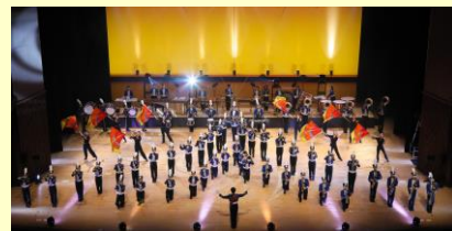
八王子学園八王子高等学校

歌って、踊って、演奏できるバンド」をモットーに、150名を超える部員が元気に活動しています。お客様に喜んでいただけるように工夫を凝らしたステージは、大変ご好評いただいています。当日は、本校自慢の飛び切りの笑顔で、一緒に楽しみましょう！！