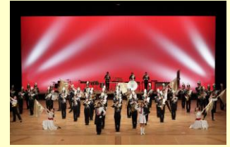
早稲田大学応援部吹奏楽団

当日は、新入部員も含めた全員で演奏を披露させていただきます。まだ、つたない部分も沢山ありますが、フレッシュな私たちの演奏をお楽しみください！