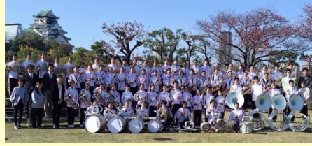
板橋区立赤塚第三中学校

「一音一心」を部訓として「厳しく、楽しく、仲良く」活動することが実行できるように日々努力しています。本日西新井中学校吹奏楽部の演奏を聴いてくださる方々との「一期一会」を大切に精一杯の演奏をさせていただきます。