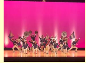
駒澤大学吹奏楽部

全校生徒650人を超える、板橋区の中でも生徒数の多い中学校です。昨年は全日本マーチングコンテストで念願の金賞を受賞しました。当日は2、3年生46人で演奏します。