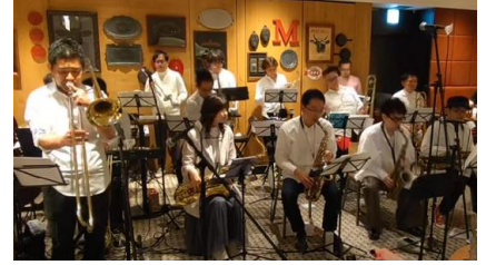
▲演奏イメージ (日比谷vibrant city jazz orchestra)

場 所：東京ミッドタウン日比谷地下1階 HIBIYA FOOD HALL 実施期間：2024年5月25日(土) / 6月8日(土) / 6月22日(土) 演奏日程：5月25日(土) 日比谷vibrant city jazz orchestra 6月 8日(土) Happy Flight Jazz Orchestra 6月22日(土) まつりパーティ ※各日18:00～ / 18:30～ / 19:00～ (20分×3回公演)