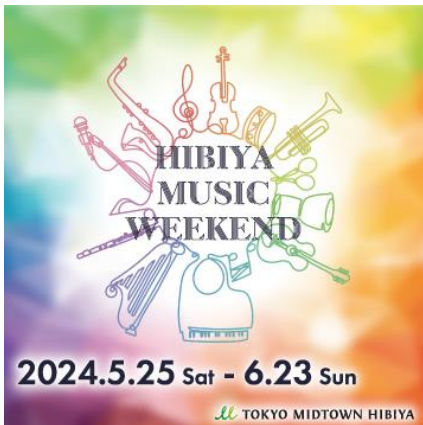
▲HIBIYA MUSIC WEEKENDキービジュアル

※正式名称は『ドリカムディスコ2024(DJ KING MASA=DREAMS COME TRUE 中村正人 / S+AKS-2)』