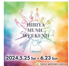
▲HIBIYA MUSIC WEEKENDキービジュアル

場 所：東京ミッドタウン日比谷 実施期間：2024年5月25日(土)～6月23日(日) 主 催：東京ミッドタウン日比谷 協 力：一般社団法人日比谷エリアマネジメント