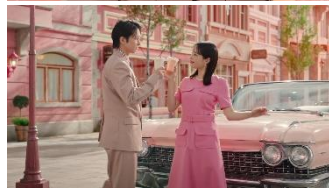
【広瀬さん】 いや！ごろっとももの季節がきました！