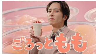
ごろっともも♪（男性）