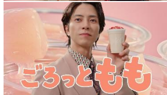
ごろっともも♪（男性）