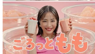
ごろっともも♪（女性）