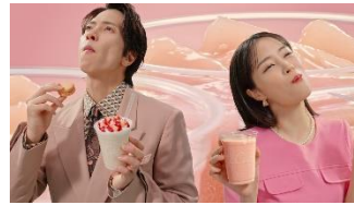
【2人】 しあわせすぎるっ！