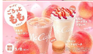
【広瀬さん】 今だけ！もものスムージーと 【山下さん】 フラッペ！