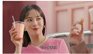
【広瀬さん】 ももすぎる！