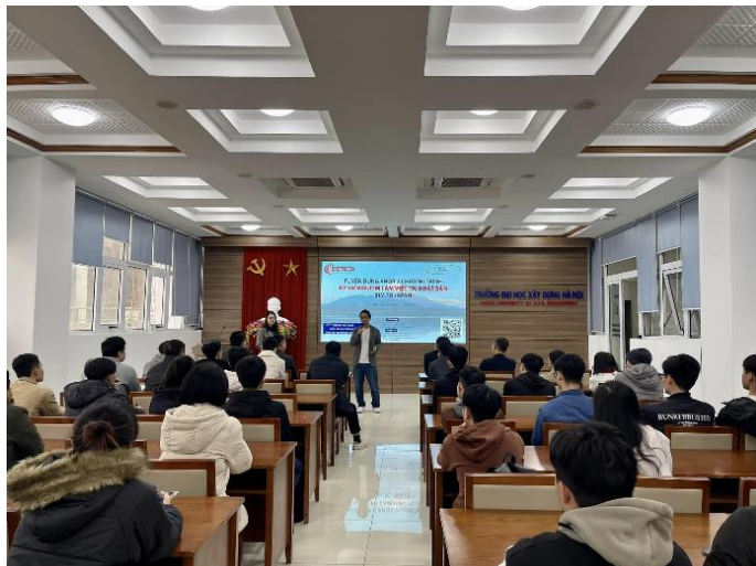
▲ベトナム人学生へのプログラム説明会の様子

※BIM/CIMとは：建築・土木分野において計画・調査・設計段階から3次元モデルを導入することにより、設計・施工・維持管理の品質向上や生産性向上を目的とした取り組みのこと。