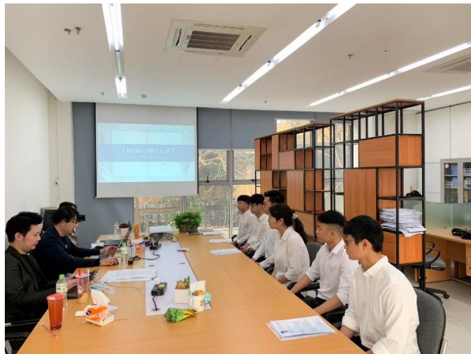
▲プログラム参加希望者との面談の様子