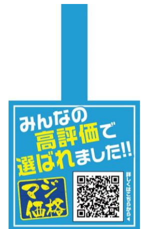
▲マジボイス選定の対象商品 POP。

「マジ価格」HP https://www.majica-net.com/campaign/majikakaku/