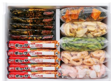
上段冷凍室の仕切り（中央設置時）