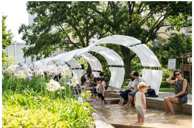
▲過去のイベントの様子