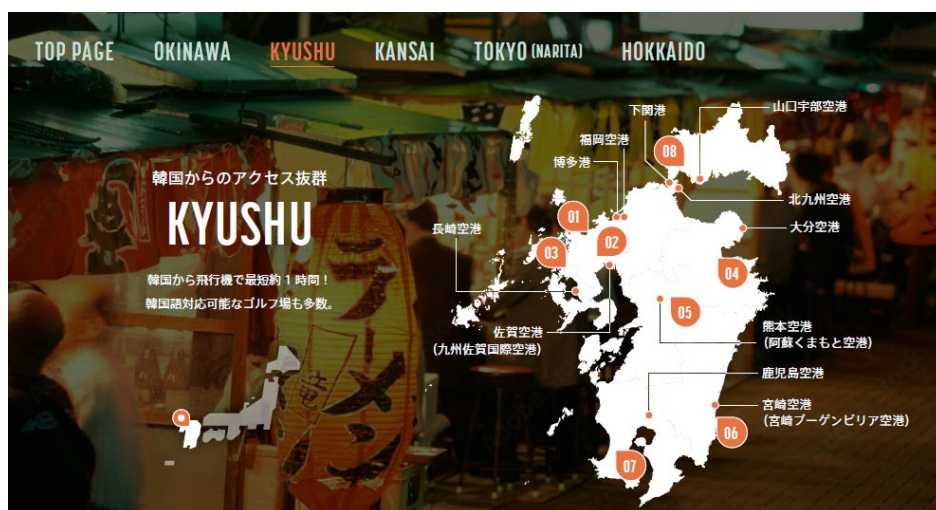
(九州エリアのおすすめゴルフ場一覧)