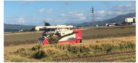
▲北海道の大自然の中で化学肥料を最小限に抑えながら生産している

「一風堂」で使用するお米に環境保全型農業により生産されたお米を使用し、グループブランドの一部店舗で使う野菜に無農薬・有機栽培の野菜を採用しています。環境保全型農業では輪作や有機物の使用、自然本来の力を借りることにより農薬使用量を極力低減。その土地の土壌や近くの海の水を汚さないよう配慮しながら栽培しています。有機栽培は、自然に負担をかけない、やがて自然に還る肥料を使用。このような農法で生産する農家・農協から食材を仕入れることで、食の安心・安全を目指すとともに環境保全にも取り組んでいます。