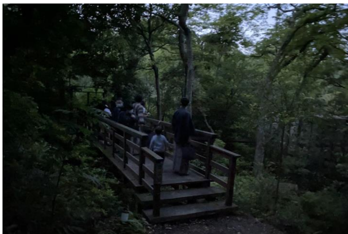
<ほたるを観賞するお客様の様子>