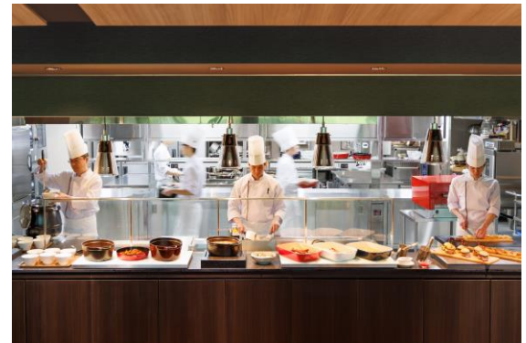
<ディナービュッフェ>