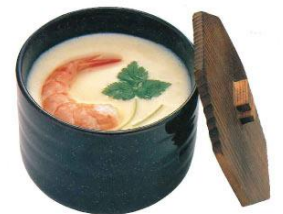
1978年当時 『ジャンボ茶わんむし』

現在も多くのお客様からご好評いただき、『名物ジャンボ茶わんむし』を食べにご来店されるお客様もいらっしゃるほど人気のある商品です。ご自宅でもお召し上がりいただけるよう、解凍して蒸すだけで簡単にお召し上がりいただける冷凍での販売を、公式オンラインショップ“おもてなし食堂”と、レストラン“和食処とんでん”の一部店舗で行っています。