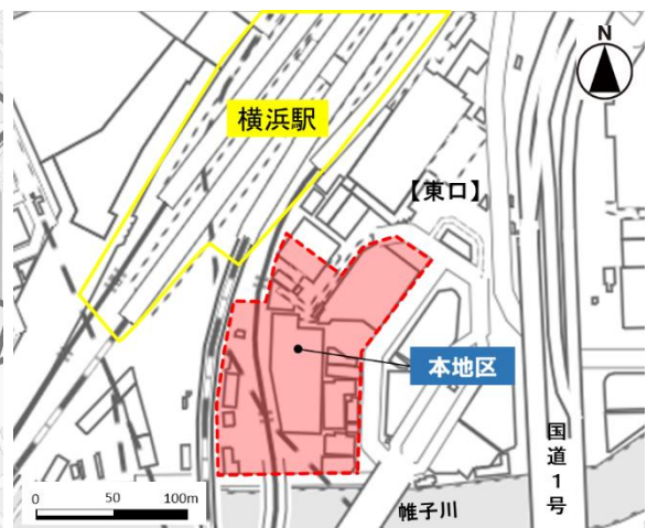
位置図 (エキサイトよこはま22「まちづくりガイドライン」より転載(一部加筆修正))