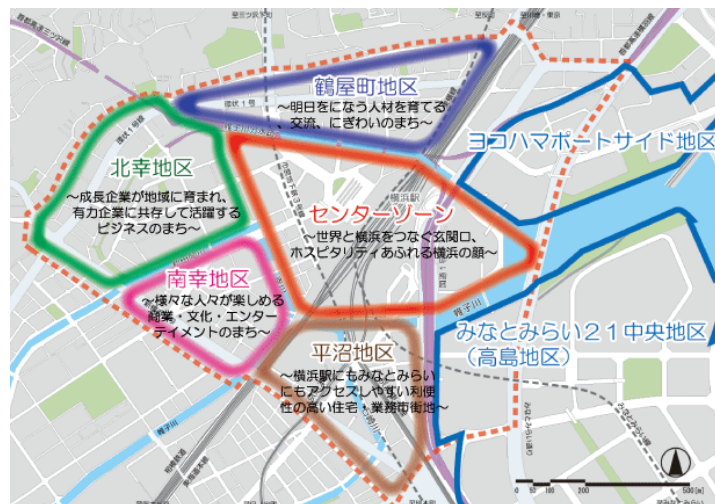
エキサイトよこはま22のエリアの説明