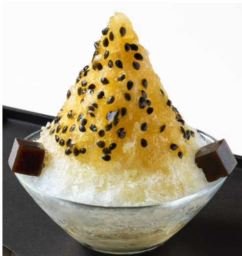
パッションフルーツ氷

銀座の喧騒をひととき離れた静かな空間で、TORAYA GINZAならではの夏の味わいをお楽しみください。