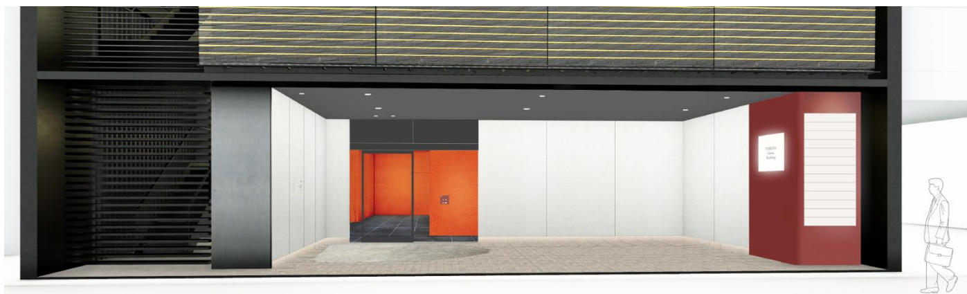
(すずらん通りに面した1Fエントランス イメージ)

TORAYA GINZA へはエレベーターをご利用いただき、4階へお越しく下さい。