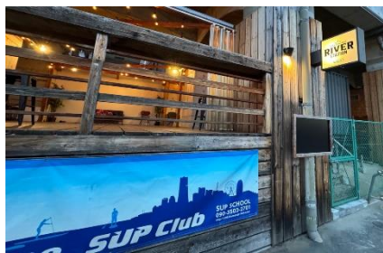
横浜 SUP 倶楽部「River Station」

京急電鉄では，スポーツ拠点を整備するとともに，水上交通の実証実験なども含め，横浜市役所周辺や伊勢佐木町，元町・中華街など関内・関外地区の広域連携にも取り組み，エリア全体の活性化を目指します。詳細は別紙のとおりです。