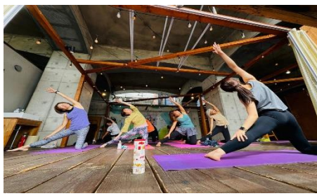
ヨガレッスンイメージ