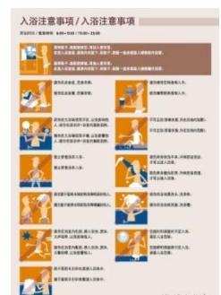
大浴場利用のご案内(中国語)

大浴場の利用方法やマナーなど、イラストを交え、わかりやすく説明したものをチェックイン時に配布。