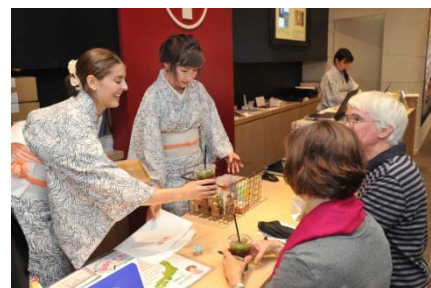
日本橋案内所にて接客する外国人コンシェルジュ

■ 当社グループでは、これまでもグループ内の各社が連携し、年間を通じてアジア各国での旅行博への出展、海外旅行社へのプロモーション、各施設における各種インバウンドサービスの提供など、さまざまなインバウンドに関する取り組みをおこなってきており、今後もさらなる外国人観光客の取り込みや利用された皆様のご満足を高めていけるよう、積極的なインバウンド活動の推進、サービスの拡充を図ってまいります。