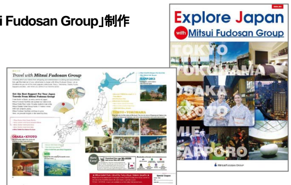
「Explore Japan with Mitsui Fudosan Group」

旅行者向けに、当社グループの商業施設やホテル、リゾート、博物館などの情報をまとめ、当社グループの女性社員の厳選お勧めポイントをまとめた観光ガイドブック。