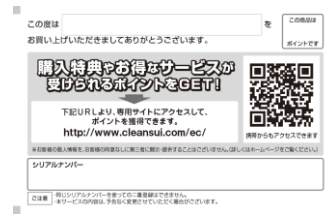
「ながもちさん(3)」キャンペーンPOP(左)と、キャンペーンシール(中)、クリンスイポイント登録カード(右)