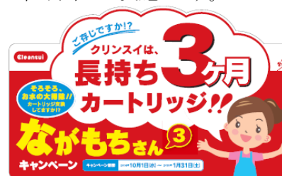
“3ヶ月ごとのカートリッジ交換”を訴求する キャンペーンキャラクター、「ながもちさん(3)」

今回のキャンペーンテーマを“《クリンスイ》のカートリッジ交換時期が他社より1.5倍長い、「3ヶ月」に設定。クリンスイなら季節ごとに計4回のカートリッジ交換で済むため、ランニングコストを削減することができます。“3ヶ月ごとのカートリッジ交換”を訴求するため、「ながもちさん(3)」キャンペーンと称しました。