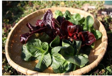
「季節のお野菜」 100円(税込)～