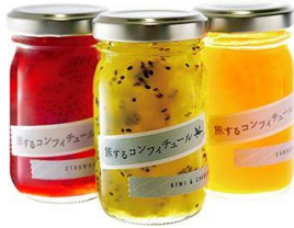
「季節のコンフィチュール」 630円(税込)～