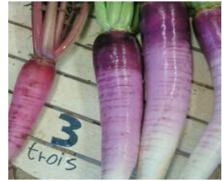
「横浜産獲れたて野菜(苜部大根)」 200円(税込)