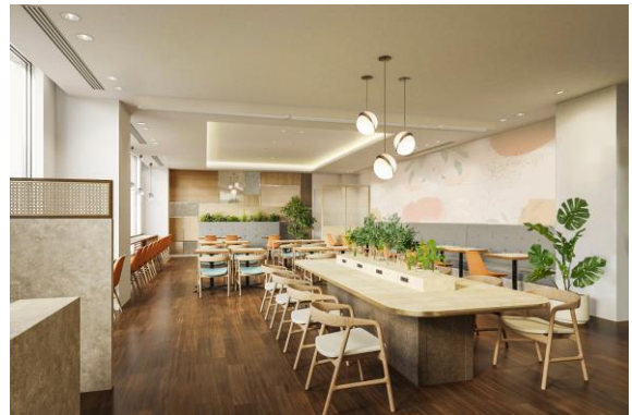
「ボンサルーテ・カフェ」イメージ

さらに、今回の朝食リニューアルを記念し、朝食をお得な価格でご利用いただける宿泊プランを販売いたします。2024年7月1日（月）から8月31日（土）までの期間限定、1日10室限定ですので、ぜひお早めにお申し込みください。