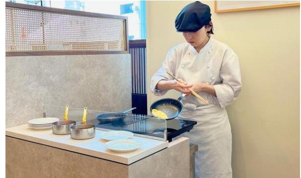
対面でのオムレツ提供イメージ

当ホテルでは、和洋あわせて常時約40メニューをお好きなだけ召し上がっていただける朝食ビュッフェをご提供しております。このたびのリニューアルでは、魚介類と季節の野菜をミルフィーユ状に仕立てた「ワシン丼」、対面調理にて提供する熱々なオムレツ、約15種類の野菜が並ぶサラダバーなどが、新メニューとして登場いたします。