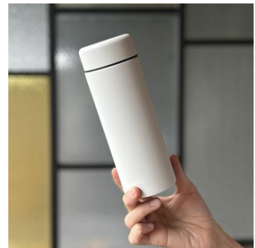
オリジナルエコボトル

このたびリニューアルした客室は、仙台藩・伊達家が用いた紋章「仙台笹」をモチーフにしたカーペットや金箔柄のクロスがアクセントになっており、豪華でありながらも落ち着いた雰囲気演出しています。グレイッシュな色合いの木柄家具で統一したほか、真鍮色のペンダントライトから零れる光は竹材独特の柔らかな明かりが、温かみのある空間を作り出します。