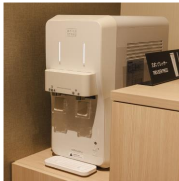
ウォーターサーバー