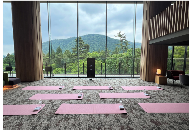
4階ロビー開催イメージ

食べ放題・飲み放題・遊び放題の箱根ホテル小涌園でマイナスイオンを浴びながら、「心と体も健康になってほしい」という思いから、ゴールデンウィーク期間中に新規のアクティビティとして開催し、大好評をいただいた本アクティビティをよりリラックスしていただけるように備品や内容を充実させて、この度本格導入となりました。会場となる4階ロビーは吹き抜けになっており、大きな窓から庭園の木々と箱根の山が広がります。壮大な景色を目の前に、デジタルヨガ&フィットネスをお楽しみください。