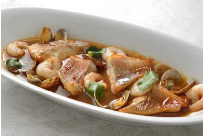
＜浅利と赤魚のトムヤムクン＞