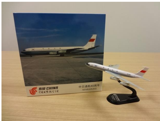
初便の B707 型機モデルプレーン

中国国際航空(CA:エアチャイナ)は、9月29日(月)に日中就航40周年 1 を迎えました。これを記念し、中国国際航空にご搭乗いただいた方全員 2 を対象とした、初便を運航したB707型機のモデルプレーンをプレゼントするキャンペーンが成田空港で行われました。