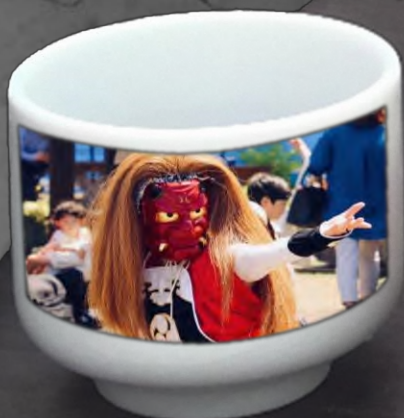
佐渡伝統芸能集団 「越佐」による車内での 鬼太鼓の演舞