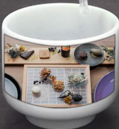
“燕三条 Bit” による 新潟の旬の食材を 使った料理・スイーツ