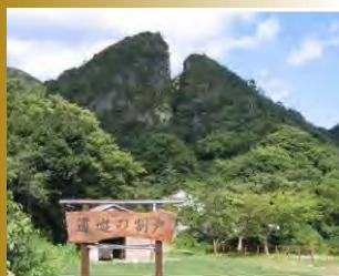
佐渡金山「道遊の割戸」

ご乗車の方には、新潟県情報発信拠点 ・THE NIIGATA (東京 銀座) ・新潟をこめ (大阪 梅田) で新潟清酒をさらに楽しめる特典を ご用意