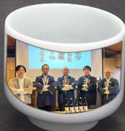
佐渡 5 歳の蔵元 または蔵人が乗車 蔵と銘柄をご紹介します！