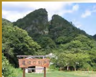
佐渡金山「道遊の割戸」