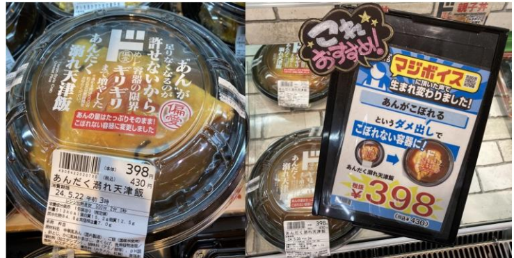
▲リニューアル後の商品と売り場