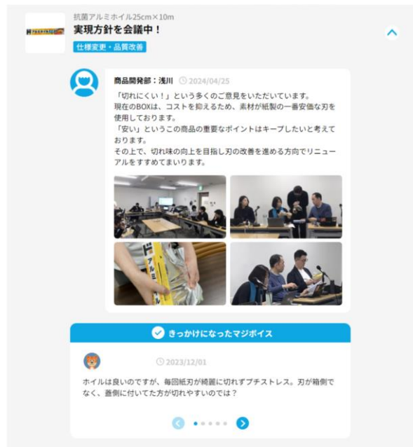
▲(左)従来とリニューアル商品の比較 (右)HP 上の途中経過の報告と、お客さまのコメント