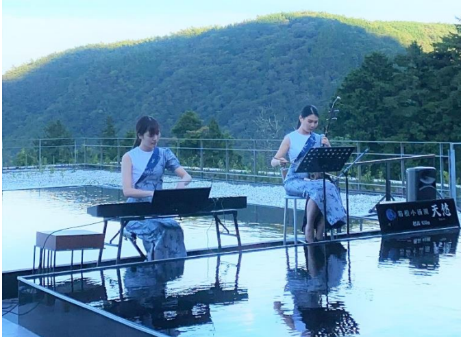
<天悠 Sunset Concert>