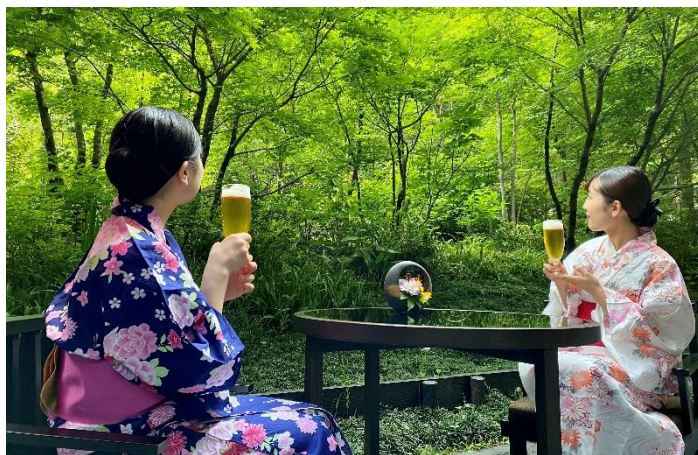
<溪谷ビアガーデン>