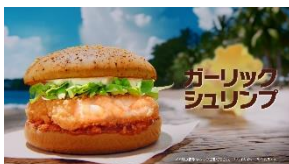
ガーリック シュリンプ