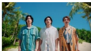
3 人 「ハワイやん！」