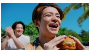
岸さん 「ハワイやん！」