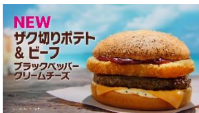
NEW ザク切りポテト &ビーフ ブラックペッパー クリームチーズ