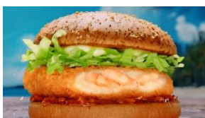
岸さん NA: ザクザク食感の ガーリック シュリンプって