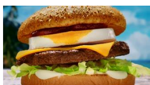
平野さん NA: 肉厚ビーフの チーズ ロコモコって