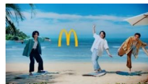
NA: お得なクーポンも！