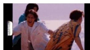
岸さん NA: めっちゃ