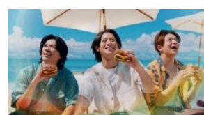
3 人 「ハワイやん！」