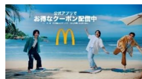
全国アプリ お得なクーポン配信中