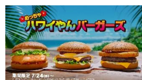
NA: めっちゃハワイやん バーガーズ マクドナルド