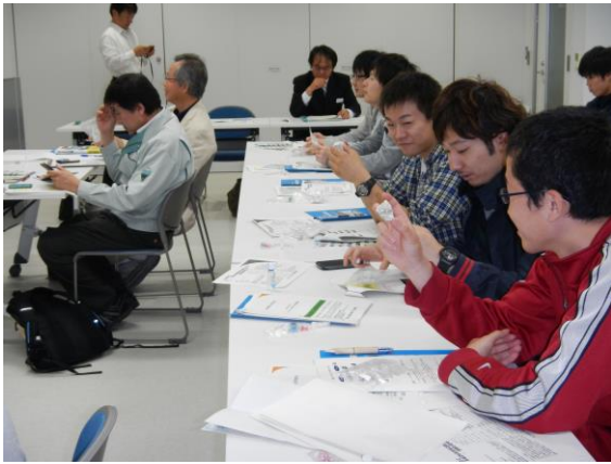
鉱石等の実物を使った講演状況