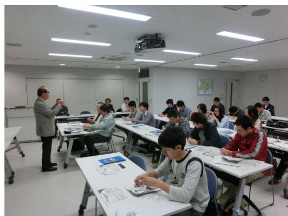
そうべつ情報館 i での講演