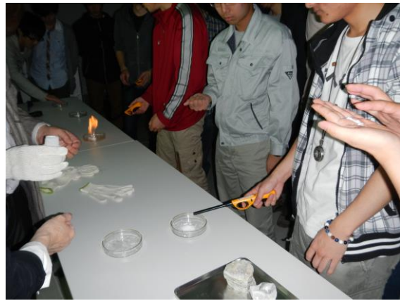
メタンハイドレート燃焼実験