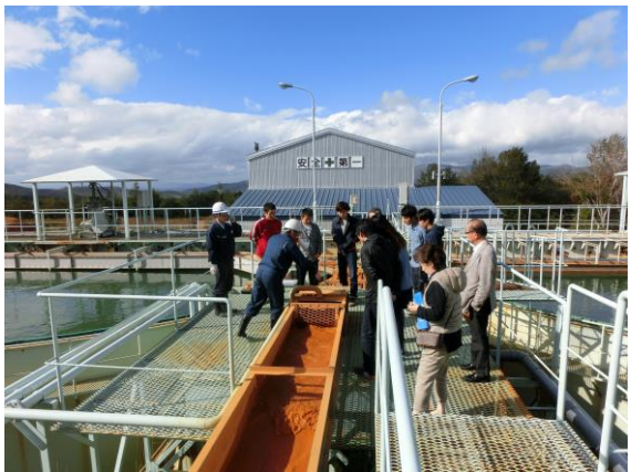
中和処理施設の見学