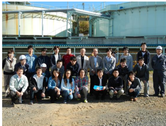
エコツアーに参加した室蘭工業大学のみなさん