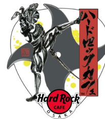
ユニバーサル・シティウォーク 大阪店