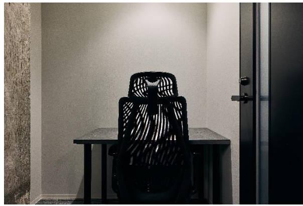
執務スペース (1名用個室)