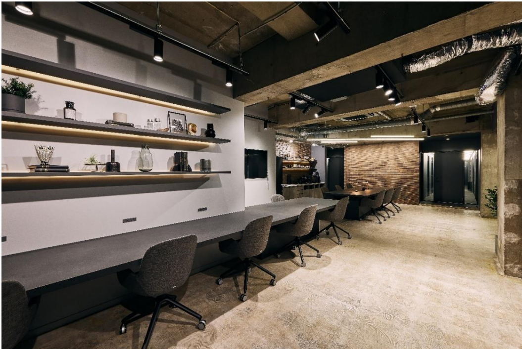
『MID POINT 市ヶ谷』ラウンジ写真（2024年7月20日撮影）

大和ハウスグループの株式会社コスモイニシアは、「職住近接」を実現するシェアオフィス『MID POINT 市ヶ谷』（東京都千代田区）を、都営新宿線「市ヶ谷」駅徒歩3分の立地に7月22日にオープンしました。また、オープンを記念し、入会金・事務手数料が0円になる1名利用向けキャンペーンを行います。