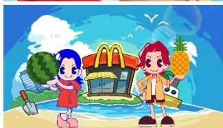
♪～ 巷でうわさの新メニュー