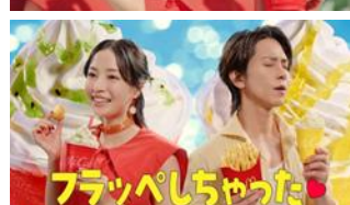
【2人】 フラッペしちゃった♡