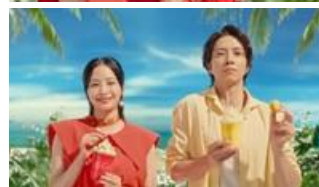
フラッホー フラッホー