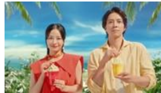
飲みたい飲みたい飲みたいな