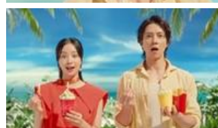
ちべたいちべたいちべたいな