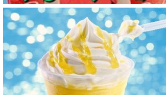
さわやか！やばいぜ！