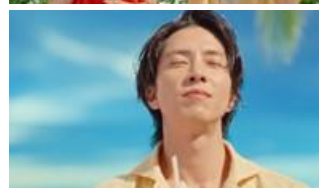
マックのフラッペ～