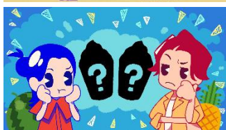
マックの新作フラッペ