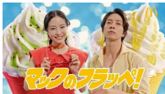
【2人】 マックのフラッペ！