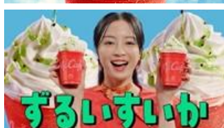
すいかのフラッペに