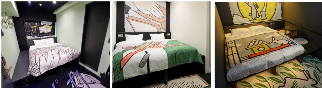
“MANGA”をモチーフとした客室内や客室フロアの内装

ホテルタビノスの空間デザインは、ジャパニーズカルチャーを代表する“MANGA (マンガ)”がモチーフとなっており、「日本らしい遊び心」をテーマに思わず笑みがこぼれるような空間に仕上がっています。お客さまを迎えるロビーをはじめ、コミュニケーションスペースであるラウンジ、ゲストルームなどにも、「くすっ」と笑える楽しいイラストが散りばめられています。