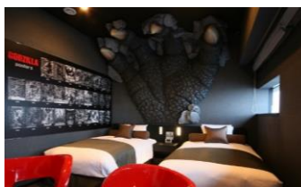
ゴジラの世界観を体現した内装デザイン 歴代の映画ゴジラのポスター展示も