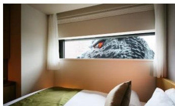
部屋の前にゴジラが現れたような臨場感を体験可能