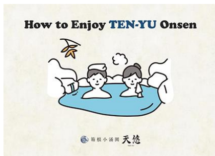
入浴の楽しみ方を伝える英語の紙芝居

一方的にチラシや看板でお知らせするのではなく、お客さまとスタッフがコミュニケーションを図りながら目の前で伝えることで、日本文化である温泉への正しい理解を促進するとともに、温泉をより魅力溢れる文化体験にすることを目指しています。