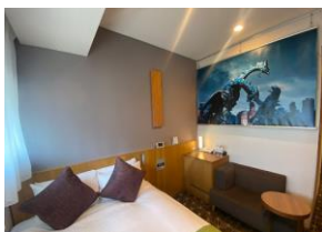
各部屋ごとに異なる6作品のタペストリーを展示