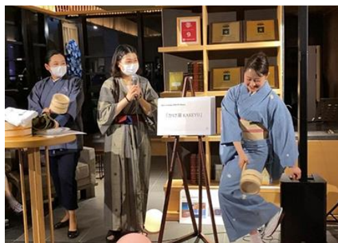
かけ湯ダンスの様子

海外のお客さまの中には、温泉の正しい入浴方法やマナーを知らない方も多く、温泉入浴を十分に楽しめていないことに着目し、「箱根小涌園 天悠」では、外国人宿泊者向けの「温泉マナー講座」を、本年2月より毎日実施しています。