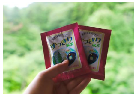
参加者にはオリジナル入浴料をプレゼント