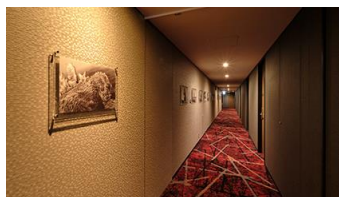
エレベーターホールや廊下などフロア共有部全体がゴジラの世界観に統一 廊下には「ゴジラシリーズ」のシーンのギャラリー展示も