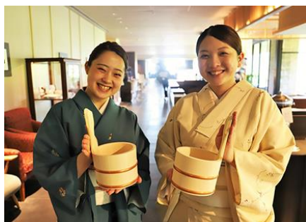
温泉ソムリエ スタッフ