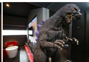
ゴジラの模型やジオラマも客室内に展示