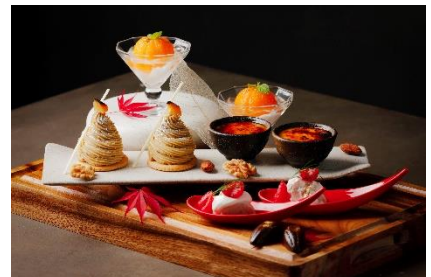
スイーツ イメージ