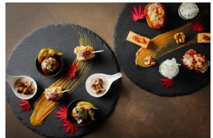
セイボリー イメージ