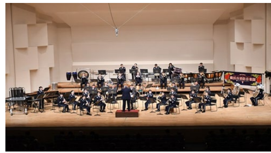
▲横浜市消防音楽隊