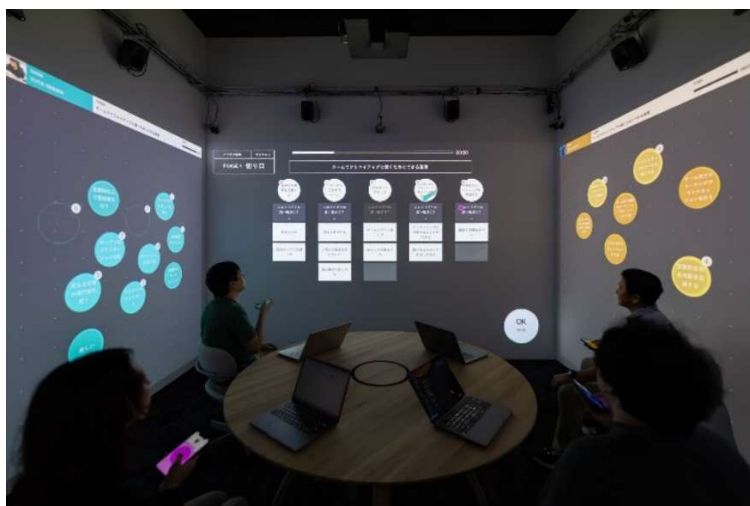
LIFORK 秋葉原に設置される次世代会議空間「RICOH PRISM」ブレインストーミングのアプリ「BRAIN WALL」の様子

「RICOH PRISM」は、チームの創造力を高めるための次世代会議空間です。オートファシリテーション機能に加えて、映像や光、音、触感といった五感に働きかける様々な空間演出によって高い没入感を実現し、効果的に会議を支援します。「RICOH PRISM」では、空間アプリケーションを切り替えることでアイデア発想やチームビルディング、マインドフルネス、アート体験等が利用でき、目的に応じて最適な体験をご提供します。