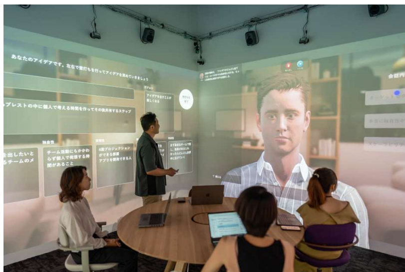
LIFORK 秋葉原に設置される次世代会議空間「RICOH PRISM」 生成 AI を活用したアイデアの壁打ちの新アプリ「KABEUCHI」の様子