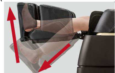
新搭載「ニーストレッチ」