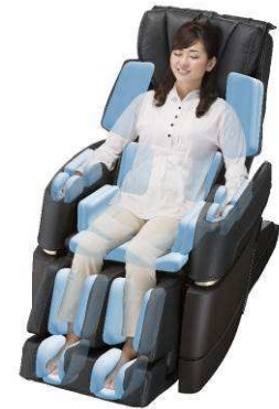
全身を包み込む「エアーマジック」

腕底部と足裏のヒーターで、冷えの症状が出やすい末端まで温めながら効果的にマッサージ。