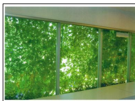
■西鉄不動産株式会社 三輪それり販売センター 様