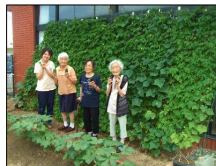
■マイルドハート坂出 様