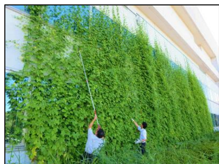
■シャープ株式会社三重工場 様