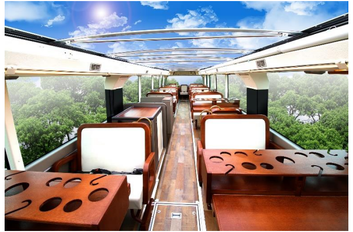
2階の座席とテーブル