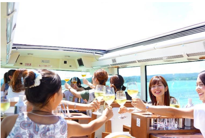
車内での乾杯の様子

さらに天井が開閉式の透明の屋根になっており、あたたかな天気の良い日にはオープントップで開放的な景色を楽しめます。天気が悪い日には透明の屋根を閉め、景色を楽しみながら快適に食事ができます。