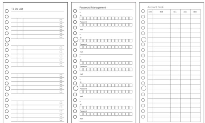
(ダウンロード罫線、左から) To Do リスト、パスワード記録用、出納帳