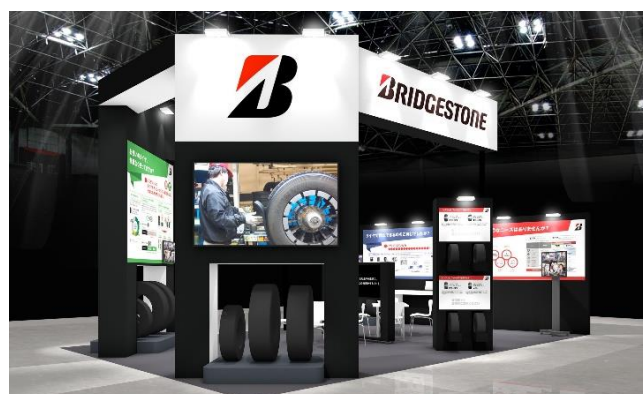
生産財ソリューション事業のブース図（東 1-603）