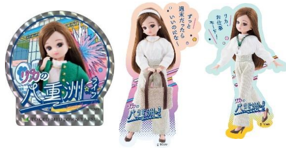
オリジナルリカちゃんステッカーイメージ

レシート対象期間：9月20日（金）～9月29日（日） 引き換え時間：各日11：00～18：30 引き換え場所：1Fインフォメーション プレゼント内容：東京ミッドタウン八重洲オリジナルリカちゃんステッカー ※期間中レシート合算可 ※一部、対象外の店舗あり