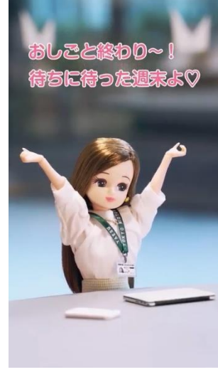
第3弾「週末旅に出る」

公開開始日：2024年9月20日（金）～ 東京ミッドタウン八重洲公式Instagram