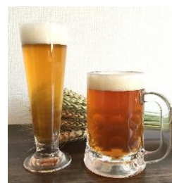
南横浜ビール研究所