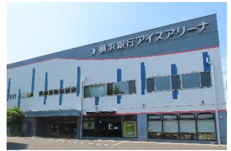
横浜銀行アイスアリーナ

横浜銀行アイスアリーナ入口前スペース 神奈川県横浜市神奈川区広台太田町1-1 (京急線京急東神奈川駅徒歩5分)