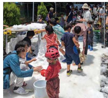
氷のあそびばイメージ

当日は、横浜のプロアイスホッケーチーム横浜GRITSがシュート体験のブースを展開いたします。選手も数名、遊びに来る予定です！是非お越しくださいませ。