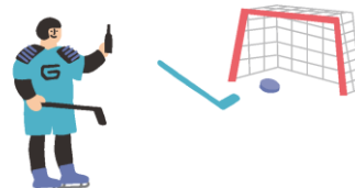
アイスホッケーシュート体験 イメージ

当日は、横浜のプロアイスホッケーチーム横浜GRITSがシュート体験のブースを展開いたします。選手も数名、遊びに来る予定です！是非お越しくださいませ。