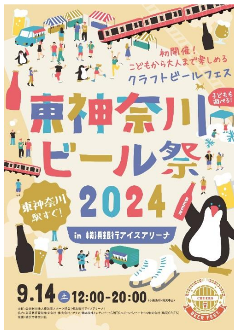
ポスターイメージ