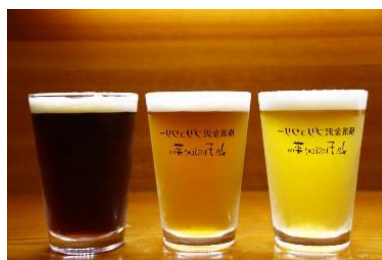
横濱金沢ブルワリー