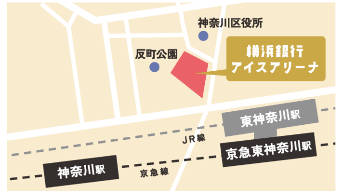
横浜銀行アイスアリーナ 案内図