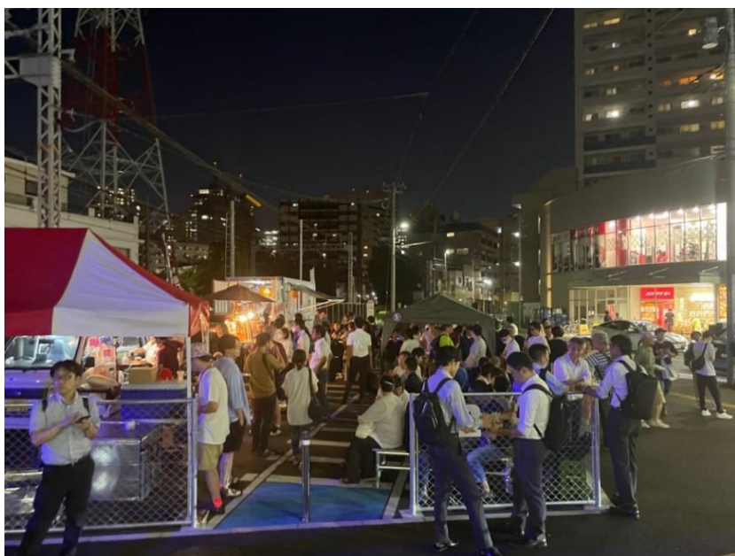
ビール祭開催風景 ※イメージ