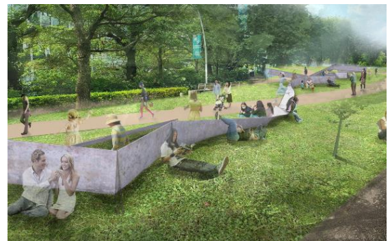
▲都市の共動態(イメージ)

ミッドタウン・ガーデンの微地形を3Dスキャンし、そのデータを基にコンクリートキャンバスでデザインされたプリミティブなオブジェ群が現れます。普段は何もない場所に出現したオブジェに、人々はどう反応するのでしょうか。立ち止まる、観察する、写真に撮る、さわる、座る、寝る…都市空間は便利な環境が当たり前となり、人々の意識や身体は受動的になりつつあります。日常で意識することのない都市の潜在的な情報を可視化、立体化することで、人々のさまざまな感性や行動を刺激して、あらためて自身が住む環境での過ごし方を発見する機会を創出します。