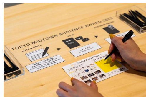
▲昨年のオーディエンス賞の様子