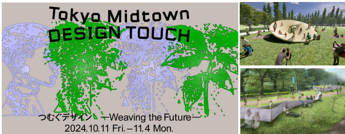
▲左:「DESIGN TOUCH 2024」キービジュアル、右上:リレキの丘(イメージ)、右下:都市の共動態(イメージ)

東京ミッドタウン(港区赤坂 / 事業者代表 三井不動産株式会社)は2024年10月11日(金)から11月4日(月・振休)までの期間、秋のデザインイベント「Tokyo Midtown DESIGN TOUCH 2024(東京ミッドタウン デザインタッチ)(以下 DESIGN TOUCH 2024)」を開催いたします。本イベントは“デザインを五感で楽しむ”をコンセプトに17回目の開催を迎えます。