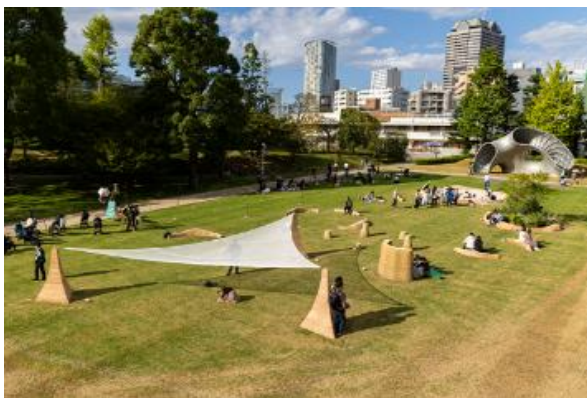
▲2023 年開催の様子 テーマは「いざなうデザイン-Draw the Future-」

DESIGN TOUCH アーカイブはこちら https://www.tokyo-midtown.com/jp/designtouch/