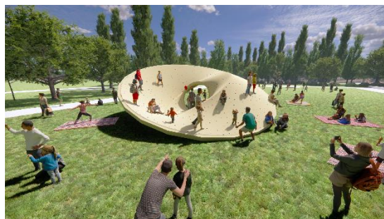
▲リレキの丘(イメージ)

三つのリングがずれながらつながることでできた木の地形のインスタレーションが芝生広場に登場。三次元的な曲面は、子供、大人問わず様々な遊びの感覚を呼び起こします。土日や祝日には木の表面に来場者の行為を表現したシールを貼ることで、その場の履歴として残るとともに色彩を帯びていきます。空間を活かした1日限定のパフォーマンスも開催され、集う人々の行動がつむがれることで、新しい景色が生まれていきます。