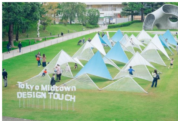
▲2022 年開催の様子 テーマは「環(めぐ)るデザイン-Design for Sustainable Future-」