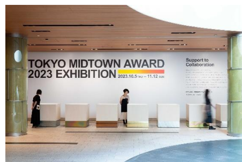
▲昨年の展示の様子