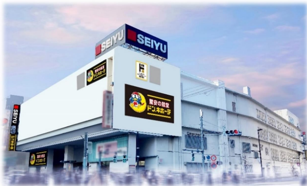
▲ドン・キホーテ調布駅前店 外観イメージ

株式会社ドン・キホーテ(本社:東京都、代表取締役社長:吉田直樹)は、2024年9月30日(月)に、「 ドン・キホーテ調布駅前店 」(東京都調布市)を「西友調布店」内の1～4階にテナント出店します。東京都調布市には初出店となります。