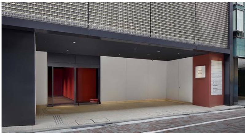
(すずらん通りに面した1Fエントランス)

TORAYA GINZA へはエレベーターをご利用いただき、4階へお越してください。