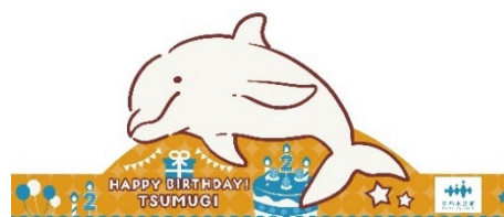
ツムギのバースデーお面 （イメージ）