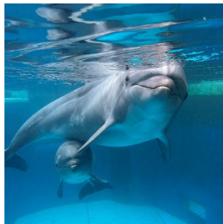
母親の「キア」と「ツムギ」

※ 当日の天候、設備、いきもの状況などにより、プログラムを中止する場合があります。