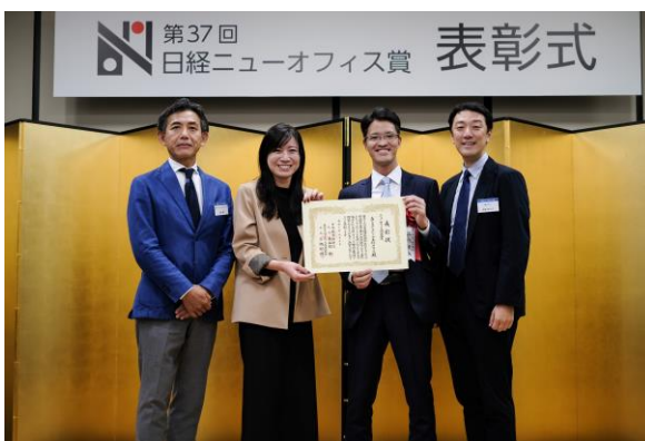
2024年9月10日に行われた表彰式

「日経ニューオフィス賞」は、日本経済新聞社と一般社団法人ニューオフィス推進協会が主催し、「ニューオフィス」づくりの普及・促進を図ることを目的に、創意と工夫をこらしたオフィスを表彰する賞です。